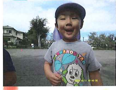
「負けちゃったけど、もう一回やったら勝ったよ！」