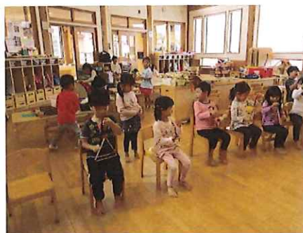
あ、音が揃ってきたね