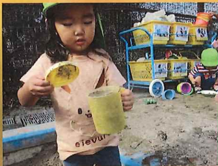
みてー、パカッするね♡