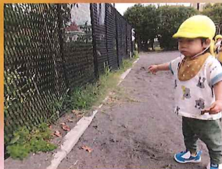
蝶々がいるんだって！