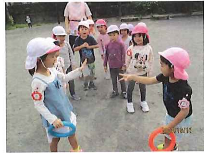
「今度は一番最初が良いな！」 「じゃんけんぽん！」

「リレーやりたいな～！」子どもたちのリクエストでグラウンドに出かけました。みんなでチーム分けをしてスタート！「がんばれ～」と応援しています。大接戦の1回目を終えると「今度は一番最初が良いな！」 「ぼくは最後走ってみる」クラス関係なく順番を決めてみることに。友だちのお話も聞いて、話し合っている姿はとても立派でした。