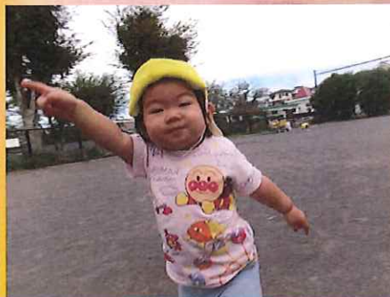
私はこっちに行ってみよう♪