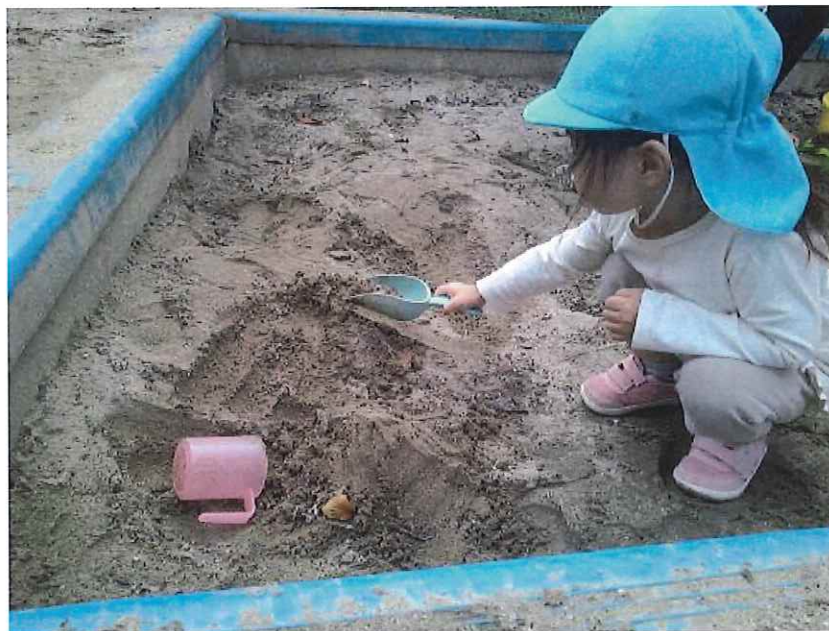
かまきりさんのおうちつくるのー！

園庭に大きなカマキリを発見！！「かまきりがいるよー！」とみんなにお知らせ。虫かごに入れて観察していました。すると、カマキリのご飯を用意してくれたり、お家を用意してくれたり・・・。とっても優しいお友だちでした。