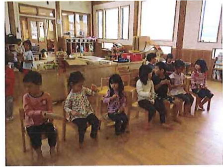
かーえーるーのーうーたーがー♪