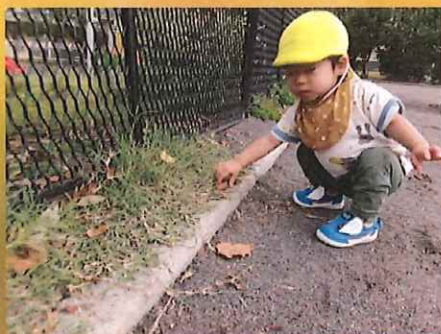
葉っぱがあったよ