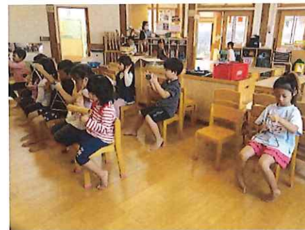
ポニョの歌がいい!