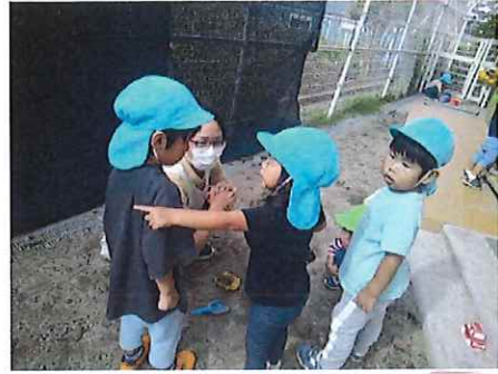
あっちにいたんだよ！