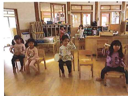
せんせい、持ち方わからな〜い