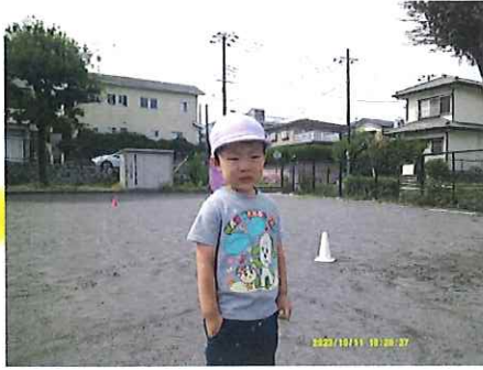
「負けちゃった・・・」