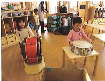
みんなのリズムに合わせるって難しい!