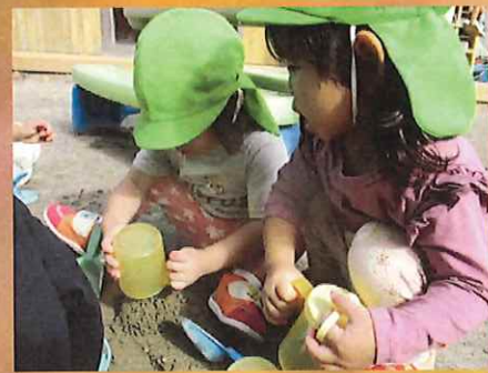
コップ、いっしょだね(^^♪