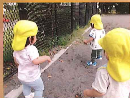
動いてるよ、ちょっと怖いね…