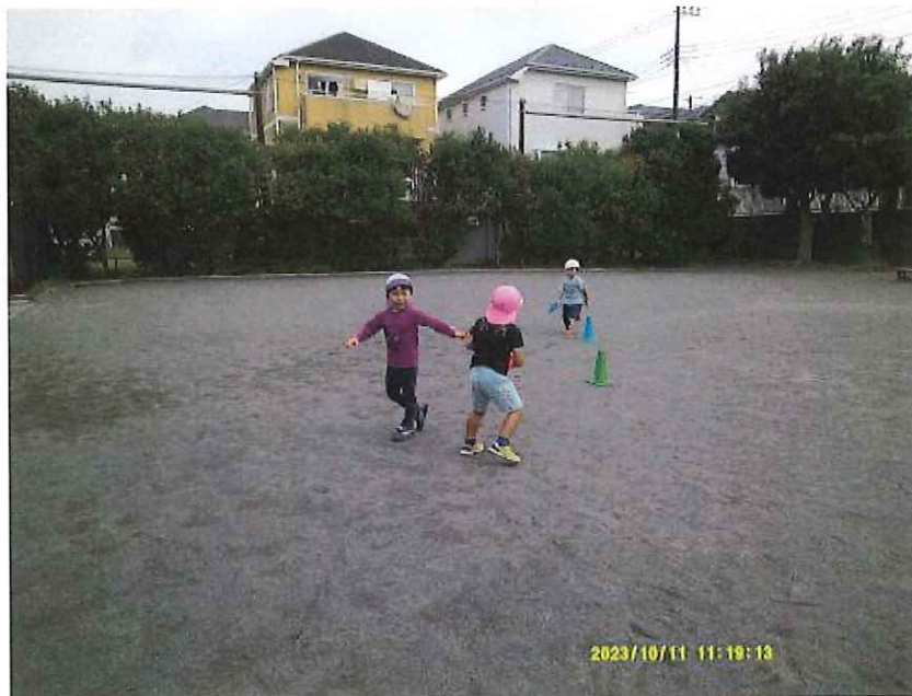
(お友だちの名前を呼んでバトンを受け取ります)

リレーで抜かされてしまい涙があふれてきたお友だち。涙を流しながらも「負けちゃった・・・」悲しい気持ちを言葉にしてくれました。しばらくお友だちが走っているのを見てもう一回挑戦! 「負けちゃったけど、今度は勝ったよ!」もう一回やってみようとする姿に感動しました。