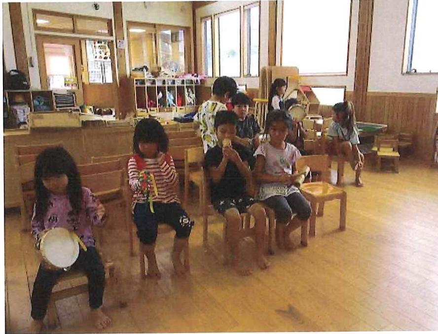
ドレミの歌知ってる！

今日の楽器チームはタンバリンや鈴、ウッドブロック、トライアングル、カスタネット、大太鼓、小太鼓などを出してみんなで楽器遊びをしました。みんなで同じリズムで奏でるのが、なかなか大変、、でも音が揃うと楽しい！！違う楽器もやってみたい♪と夢中になって楽器遊びをしていましたよ♪