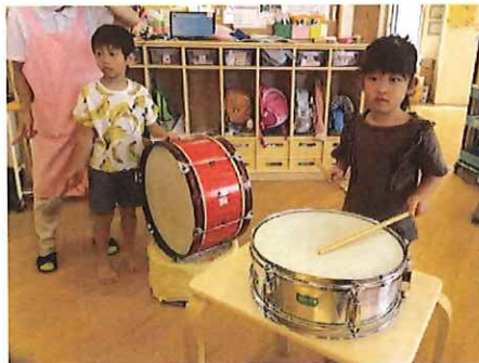
すごい大きな音出るじゃん!