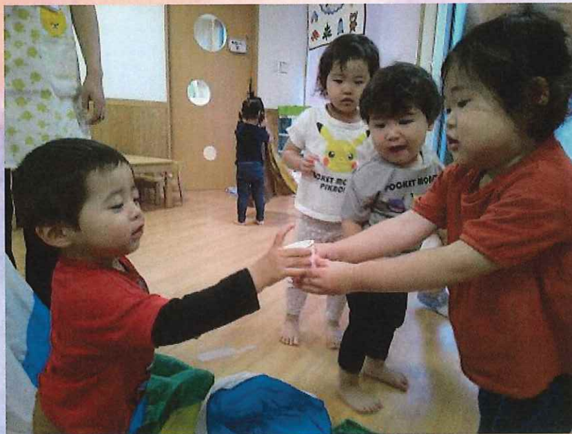
どうぞ。ありがとう。

ハイハイ競争と大好きなパラバルーンを思い切り楽しみ、笑い声が響いてました。お茶の時間も気にせず遊び続けるお友だちに、「お茶ですよ」と伝えたり、自分から進んで「持っていく」と言い運んでくれる優しい姿が見られました。