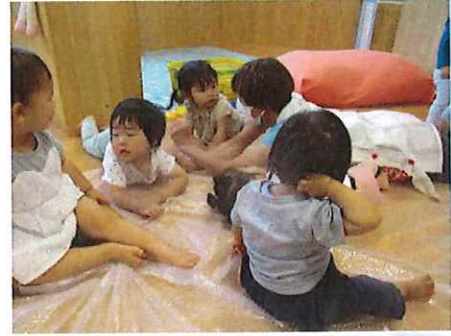
がしゃがしゃ～、くしゃくしゃ～♪