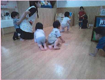
ハイハイきょうそう