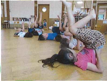
（足が高く上がってきました！）