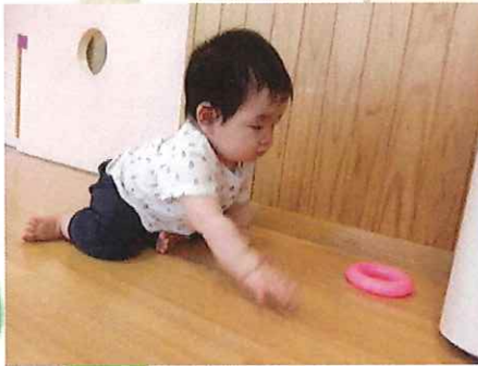
行ってみようかな？