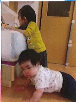
また触りに行こう♪