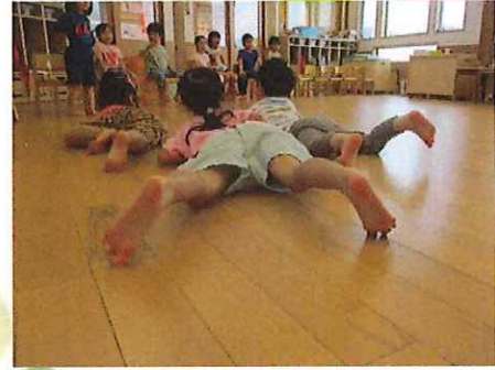
（親指をしっかり使っていますね！）

金曜日はリズム遊び！「すみれ先生やる！」すみれ組のお友だちは自ら前に出てきてカッコいいお手本を見せてくれました。手の先から足の親指まで意識をして体を動かしていく子どもたち！どの動きもよりカッコよくなってきましたよ。