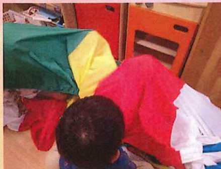
おちゃのじかんだよー かくれてるの？