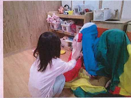
おちゃもってきたよ