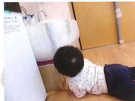
よいしょっ触ってみたいな～