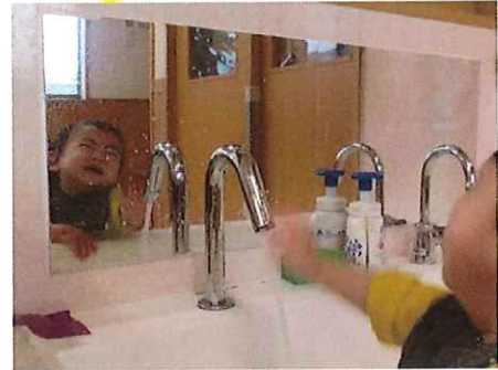
冷たくて、気持ちがいいね♪