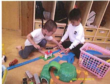
これならつながるよ！