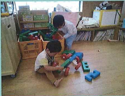
こうやって・・・