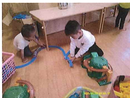
ここにもつなげてみよう！