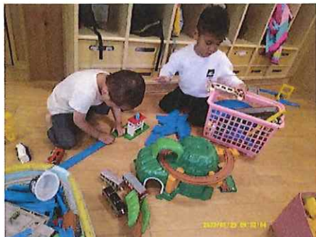
くっつかないなあ・・・