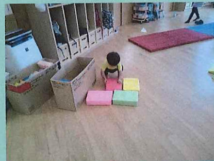
こうやって・・・

今日は、ホールで体を動かして遊びました！平均台をゆっくりゆっくり慎重に歩いていきます。大型ブロックで車を作っていたお友だちは、一緒に必要な形を探して「いっしょー！」と仲良し！「いいものみーつけた！」と台を出して並べているお友だちもいましたよ。