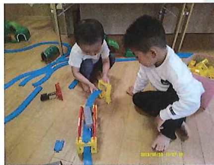
もう一個つなげる！

室内チームのプラレール遊びでは友だち同士で工夫しながら線路を繋げる姿がありました。「つながらないなあ」とちょっと困っているお友だちに「これでいいかな」と声を掛ける優しい姿が印象的でした。