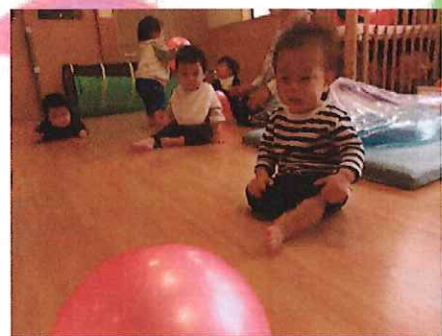
ころころ動いてる！