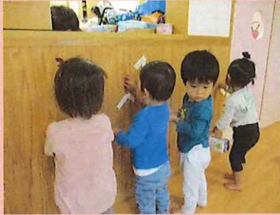
ビリ!ペタッ!! バリバリ～。ん?でんし ゃ!!