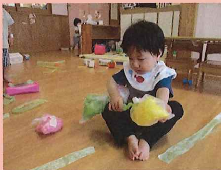
クシャクシャ、ポーン。