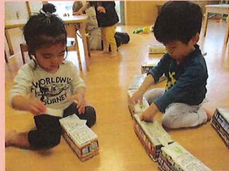
でんしゃ、ペタ!ペタ!!