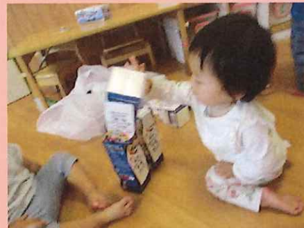
うーんしょ、うーんしょ。