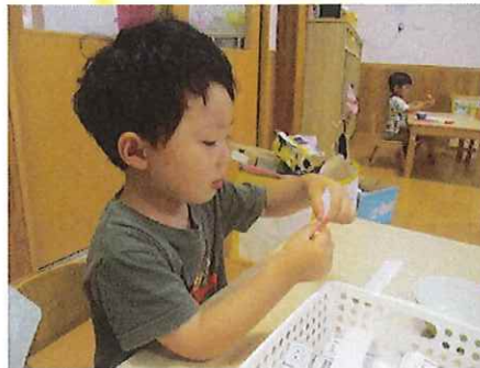
「ここを切りたいんだ〜」