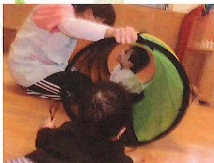
ばあー！入ってみようかな。