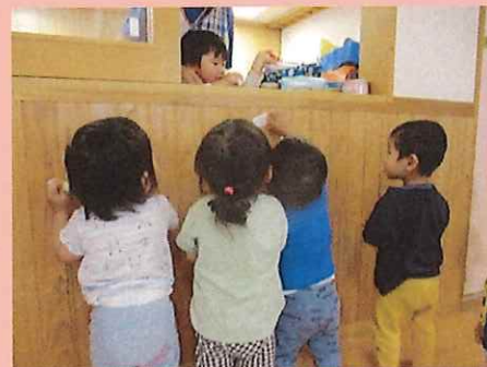
ねえねえ、ちょーだい♡