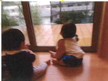
ポツポツ降ってるね。