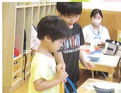
「ネックレスにしたいんだ」「ここをくっつけたらいいと思うよ！」