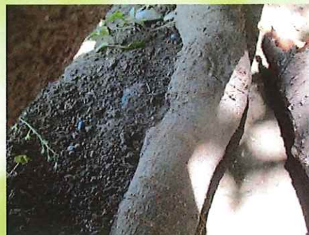
いっぱいころころしてる！