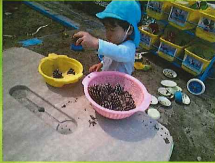
こっちにいれて・・・