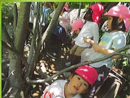
ダンゴムシみつけたよ！