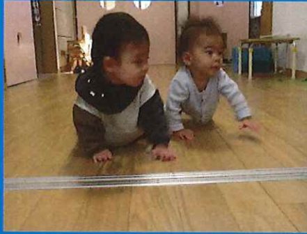
どこに行くのかな？