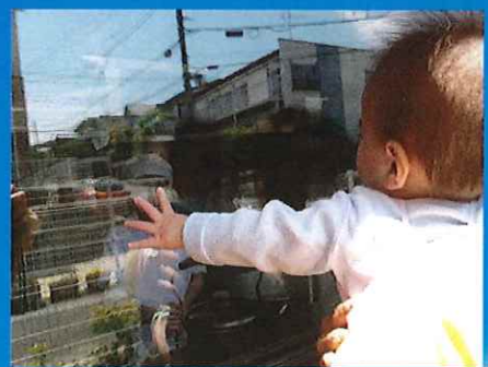
美味しそうなお飯が見えた🍴