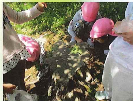
ここでバーベキューしよう！