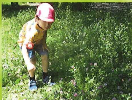
お花畑見つけたよ！