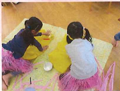
わたしたち「プテラノドン」！ねえ、ここにリボンをつけない？