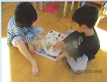
この恐竜はこんな色なんだね