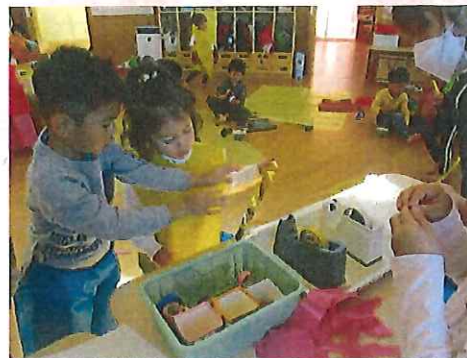
ぼくがてつだってあげる！！