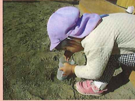
コップにいれてみよう