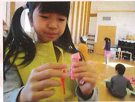
これは、ぼうしにつけて、、、。