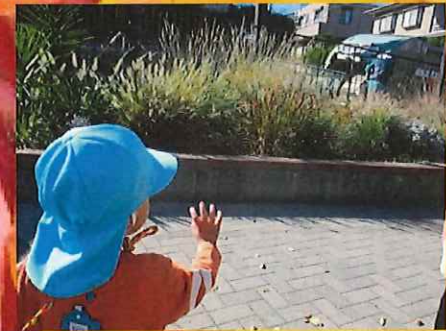
しゅうしゅうしゃバイバイ～

どんぐりを探しにグラウンドへ！広いグラウンドに大喜びの子どもたちは全力ダッシュを楽しんでいました(*^^)v園庭に戻ると「まだあそびたい～」という声が聞こえてきたので、また今度グラウンドに遊びに行こうと思います！☆