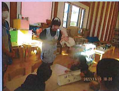
渡すときのお約束！（はさみを使うときのお約束を伝えています）