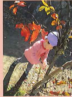
ここの葉っぱはあかいね