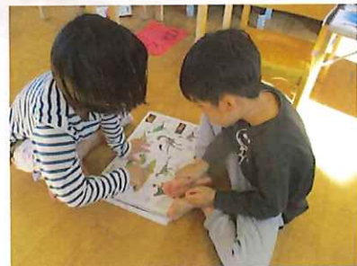
「ブラキオサウルス」って、しっぽ、ながいんじゃない???