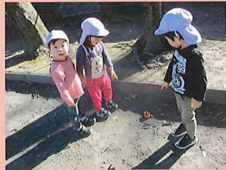
ねえねえ、これなあに

お外にでてみるとおもしろいものがたくさん！白い石を見つけると「なんだろう…」と手に持ってコップに集める姿がありました。葉っぱが風で動いている姿にもびっくり。いろいろなところを歩いていると柿を発見。「これなあに」と不思議そうに見ていると、「カラスが持ってきたのかなあ…」という声も聞こえました。