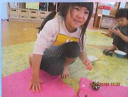
松ぼっくりをつけてみた♪