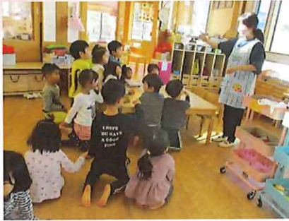
ホールの中は、せいさくのコーナーになっているよ♪つかいかたの「おやくそく」をみんなでまもろうね。