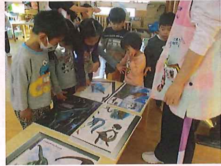
このきょうりゅうみたいないろ、あるかなあ〜。