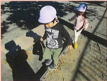
ここもあるいてみる