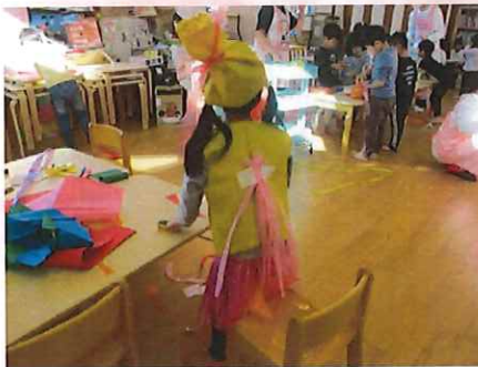
うしろもみて！しっぽもかわいいでしょ♪