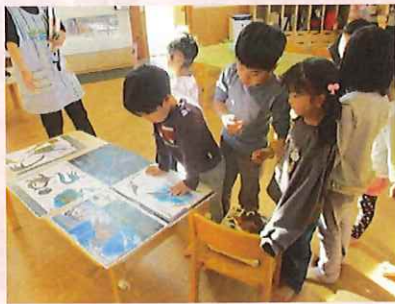
おれ、こんなのつくりたい！！よおーく、みておこうと♡