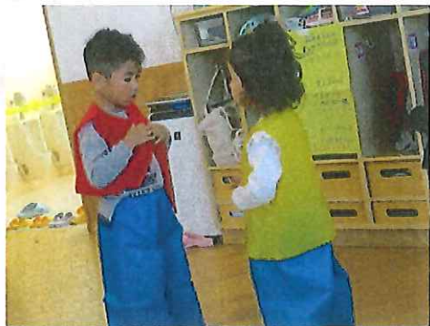
ねえ、テープつける？