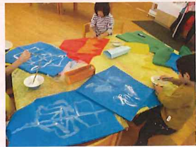
ボンドで、ちがういろの「つの」をつけたいんだー。