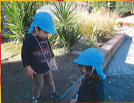
ここにいたよ (バッグに入れてました！)