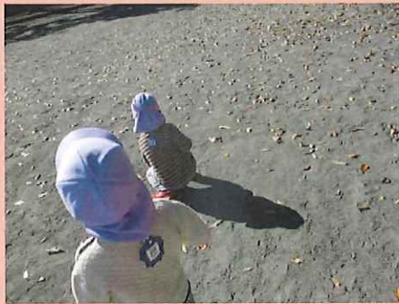
わあ！葉っぱがうごいてる