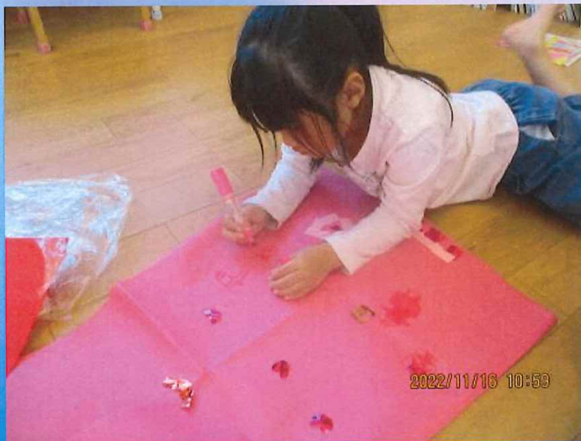
うさぎちゃん描こう！

自分になりたい恐竜の衣装作り！絵本に出てくる恐竜と同じ色で作る！というお友だちや、好きな色で模様を描いてオリジナル恐竜を作っているお友だちなど様々です♪みんなどんな恐竜にしようかな～と悩みお友だちと相談しながら進めています。仕上がりが楽しみです！