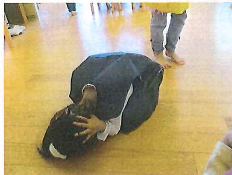
こうやって、まあるくなってるくんだよ(*^-^*)