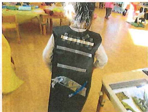
「ダンゴムシ」です。どう？