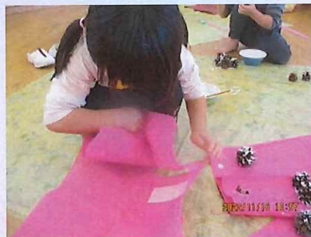
上のお洋服はどうしようかな～