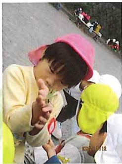
(カマキリのお顔はどんな感じかな？)

朝の自由遊びの時間に写し絵をしていたお友だちが、カマキリを発見！(昨日見つけ夕方逃がしてあげたカマキリでした)2匹いて始めは脱皮しているのかな？と話しながらじっくりと観察をしていると、「大きいカマキリが小さいカマキリをさ…」と気付いているお友だちもいました。自然界の生きる力が垣間見えた瞬間でした。カマキリが僕のこと見てる。“カマキリ”ってポーズしてるみたいだよ！と昆虫太極拳を思い出していました。