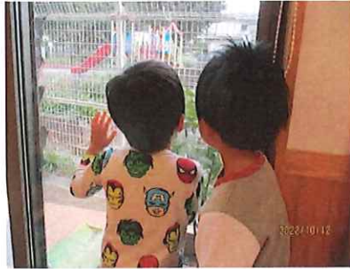
ねえねえ、カマキリがいるよ！脱皮してるのかな？