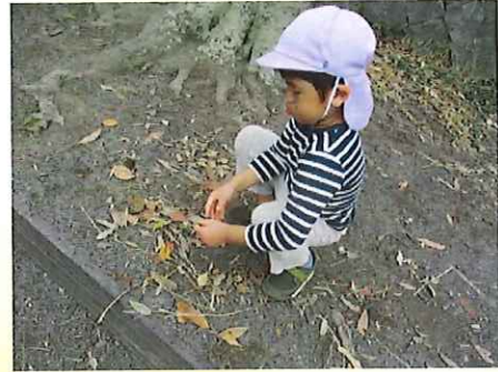
こっちにもいっぱいあるよ！