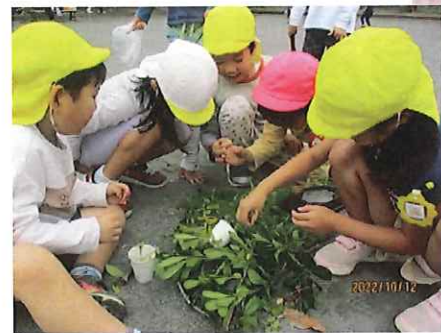
カマキリのおうち作ってあげてるんだ～