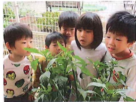
え？お腹が茶色になってるよ？