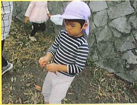
このはっぱ、かたいなあ。