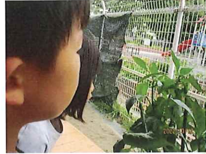
どこにいる？2匹もいる！！(大きいカマキリと小さいカマキリがいます)