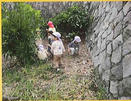
むしさん、いるかなあ？