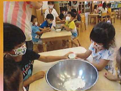
お水入れているの? 半分って言ってたよね? 少しずついれよう...