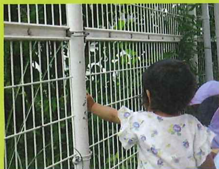
あっちには葉っぱがたくさんあるわ