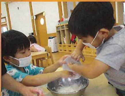
サラサラのも入れていいって!!