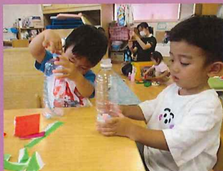
自分で椅子を持ってきて。お隣でいっしょに♪

折り紙をびりびり~とちぎってペットボトルの中へ!と、思ったら大きすぎて入らない...よし、こっちはどうかな?と押し込んでみます。また入らない...今度はこっち!入った!これはどうかな?色んな大きさを試して楽しんでいましたよ。