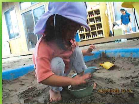
ケーキつくろうかなあ