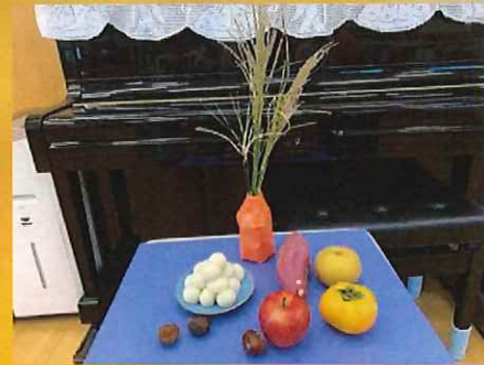
お月見団子の完成!