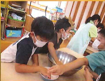
こっちはサラサラだ!