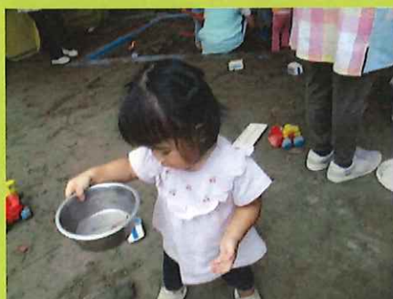
落ち葉を切って集めたのよ～