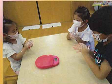
28gになるといいんだって