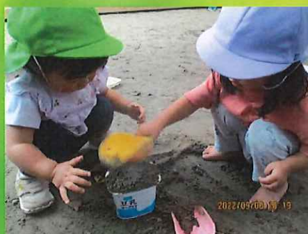
もういっかい！一緒に作ろう～