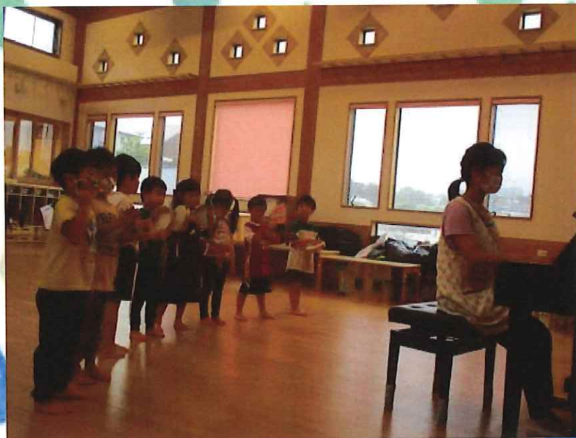
おもちゃのチャチャチャ！！

今日はあいにくの雨・・・なかよし広場で楽器遊びをしました！ タンバリンは？ 鈴は？ カスタネットは？ どんな音がするのかと、一つ一つやってみたい楽器を触り、ピアノに合わせてながら、音を鳴らしてみました(*^-^*)