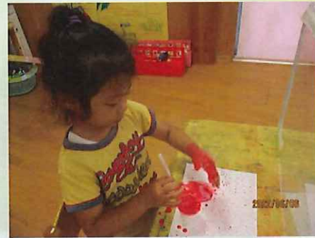
手にも付いちゃった

バブルアートに挑戦しました!!!好きな色の絵の具、シャボン液、水をまぜまぜ……紙コップから溢れるほどぶくぶくして、紙にきれいな模様ができました。「先生!見て!!!」「こんなになったよ」と目がキラキラでした!