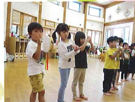
カエルのうたが・・・