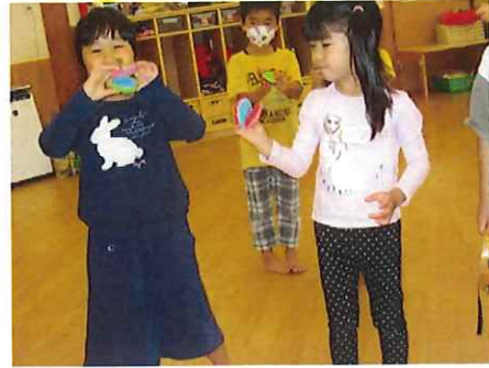
こんな音がしてる