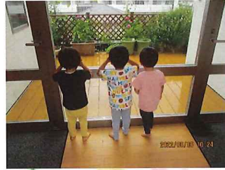
おそともみえるよ！