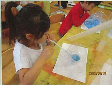
きれいな色でしょ♪