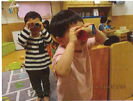
あっちもみてみよう！