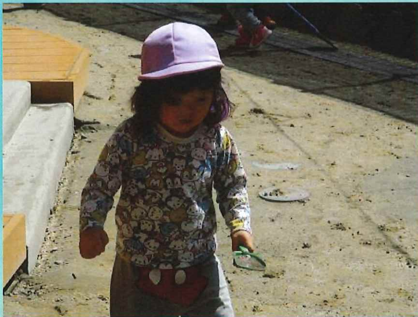
こぼれちゃうよー。

雨上がりの園庭は、不思議がいっぱい。水たまりの上の段ボール、なんだろう？踏んでみたら水が出てきたよ。何だかいつもと砂が違うね。もっと水いれてみようよ。不思議さから遊びが広がっていきました。