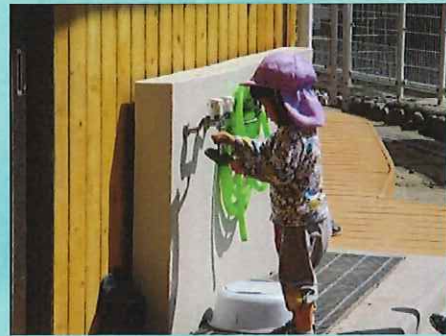
もっとみずいれてみよう。