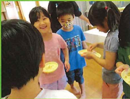
ねえ！いっぱい芽が出てるよ！！