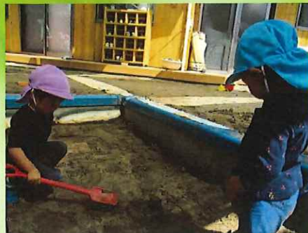
「ケーキだよ」（じ〜っと見えています）