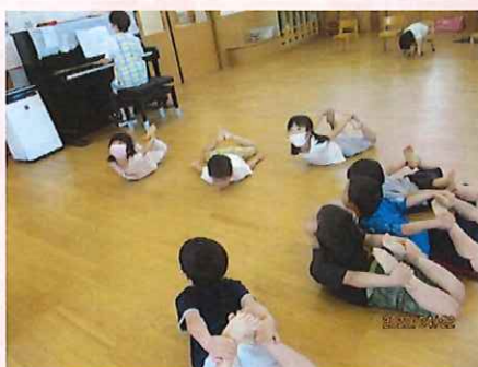
こうやってやるんだよ！