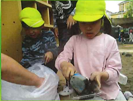
2回ぐらい入れるの？