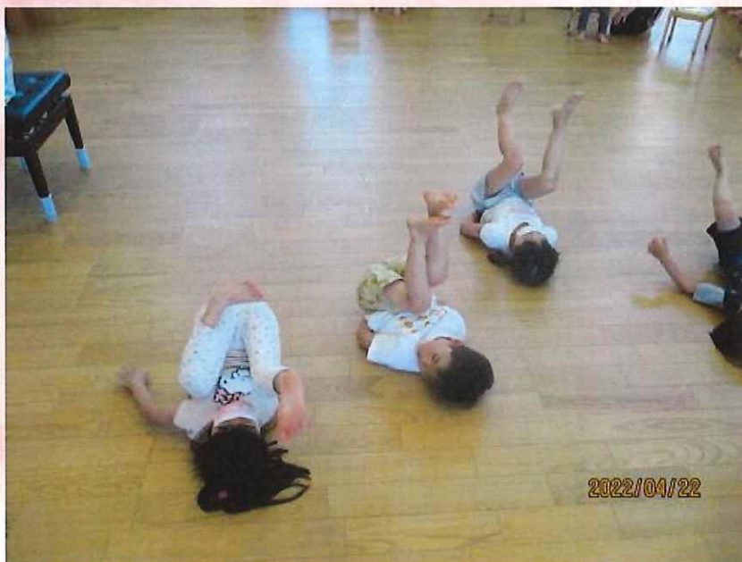
お尻が上がらないよ～！

2グループ目のリズム遊びです。お部屋で遊んでいると1グループ目のエビカニクスが聞こえてきて、思わず踊りたくなってしまったようです！遊びながらノリノリで踊っていました！まだかまだかと自分の番を楽しみにしていました。すみれ組さんのかっこいいお手本を見て「あれできないよ～」とドキドキしながらも頑張っていましたよ！