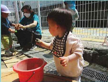
入れてみようかな

園庭にあったバケツを見つけてテラスの上まで運んできました。それからバケツを触ってみたり、石を見つけて入れてみたりといろいろ挑戦していました。すると年上のお友だちも集まってきて、砂を入れたりしている様子をじっと見ていました。