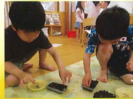
くっつかないように・・・

リズム遊びの後は、お米の『種まき』をしました。種もみ出たお米も小さな芽がニョキニョキと出てきて『芽が出てきてる！！』『いっぱい出てきた』と嬉しそうな子ども達(*^-^*) お米が出来るといいな・・・と思いを込めていました。