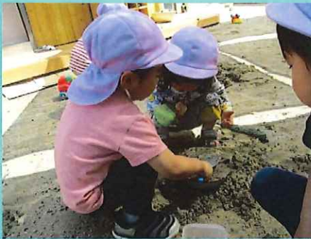
おすながちがうね。