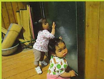
ここはなんだろう??