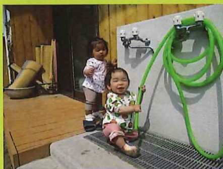
いいもの見つけたよ～！