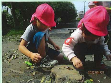
だんごむし集まれ～