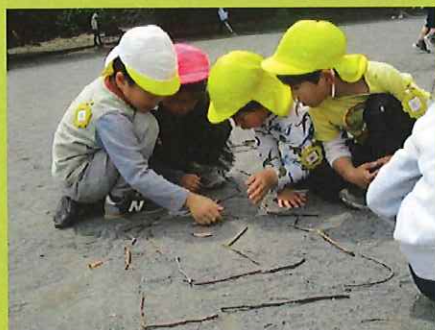
なにになに？幼虫がいたの？