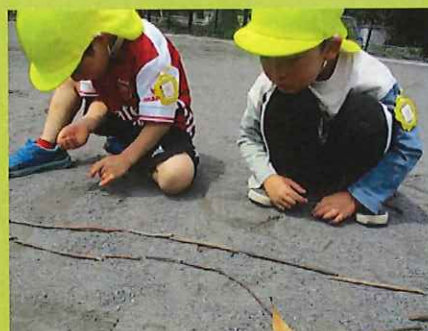
こっちにもお家を作る