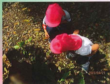
ここにもいるかな？