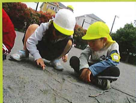
ダンゴ虫が脱走しそうだよ！

今日はグラウンドに行きました。お相撲ごっこがプチブームになっていて『今日こそは負けないからね』と気合を入れながら、何度も試合をしていました(*^-^*) お相撲の途中でも『幼虫がいたよ！！』と話が聞こえると、幼虫!?見せて！！と、遊びも幼虫観察に変更・・・ダンゴムシや幼虫のお家づくりに夢中になっていました。