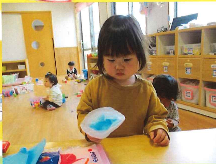
かしゃかしゃ・・・

お花紙を使ってこいのぼり制作をしました! 「なにそれ?」という様子で集まってきたりす組さん♪「くしゃくしゃして、袋に入れてね♪」と言うとじっくりと取り組んでいました! 中には「あか!」と色を言いながら選ぶお友だちもいました(#^^#)