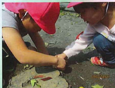
逃げてる逃げてる！！