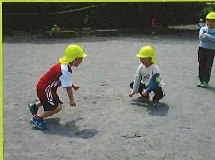
はっけよい、のこった！！