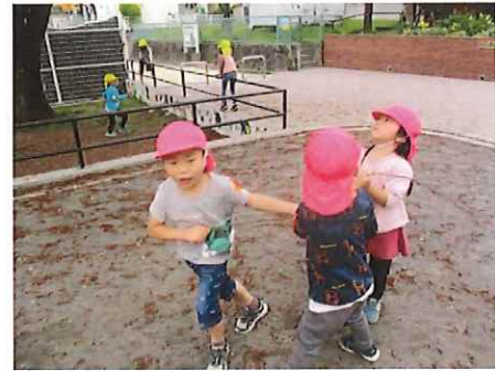
私が使う！ぼくの番！！

なが～いツルを釣り竿に見立てて魚釣りをしていました。遊具の上から垂らして「お魚くるかな～」と待っていると…？お魚役のお友だちがぱくり！ツルをつかんで引っ張りっこ。エサが食べられてしまったり、お魚が釣れたり…途中で釣り竿の取り合いになりましたが、「じゃあいっしょに使おう」と仲直りです！