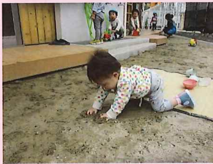
ギュ～ッとやってみよう！