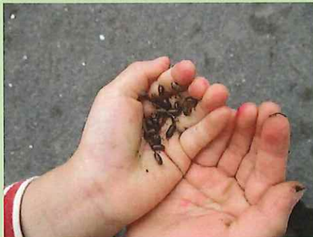
いっぱい見つけたよ！ くすぐったい・・・