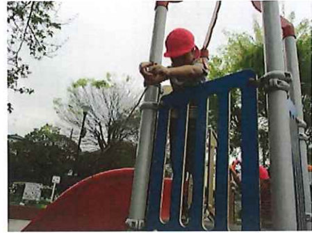
ここはお魚いるかな～