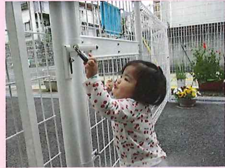
触ってみようっと。