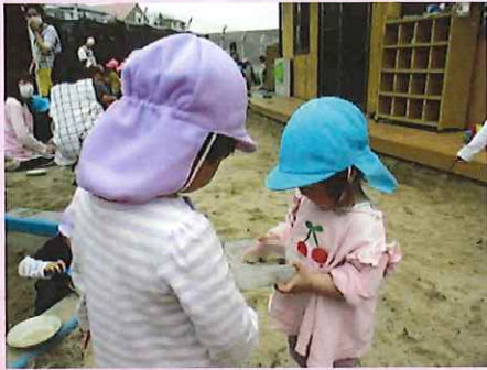
カラン、コロソ・・・♪