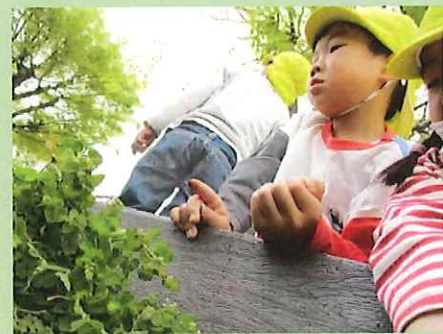
やったー、幼虫ゲット～

今日は第1公園に行ってきました。小さなクラスにお友だちがダンゴ虫を探していることを知ると、『見つけてきてあげる！』とたくさんのダンゴを捕まえてきてくれました(*^-^*) ダンゴ虫を探していたら、小さな幼虫を見つけ大喜びしていました！！