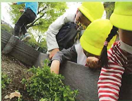
ねえ、幼虫発見した！！