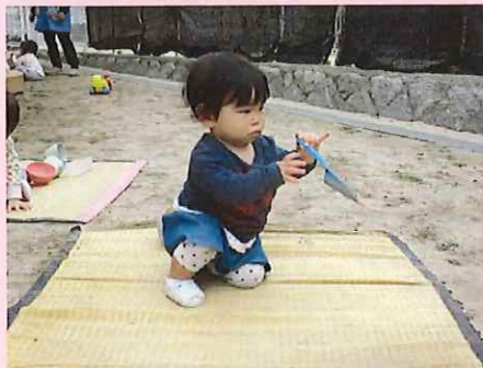
これ、見たことある！