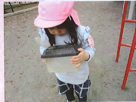
みて！あかちゃんバツ！じょうずにとったね。