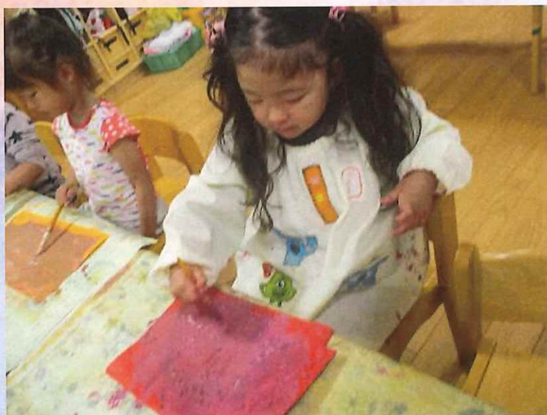
なんかぼろぼろ出てきた！！

今日はカスタネットに絵の具で色を付けました！それぞれ色を混ぜて自分だけの色を作っていました。カスタネットが塗り終わっても「まだやりたい！」と画用紙にお絵描き！ずっと筆で描いているとぼろぼろが出てきて大笑いでした！