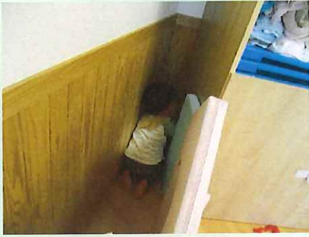
なにしてるのかな？