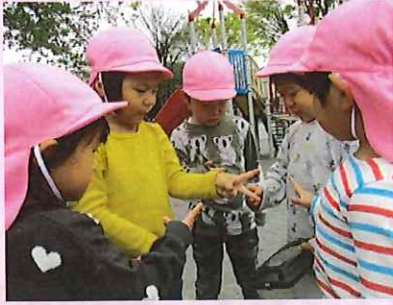
じゃんけんをきめよー！ さいしょはグー、じゃんけんぽん！