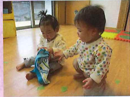
わたしも触ってみようかな。