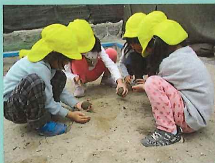
ここがお団子のお家だよ