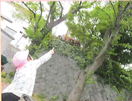
あーんなにたかいところにいるんだけどねー。