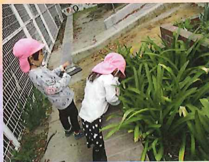
ここにたくさんいるんだよ。