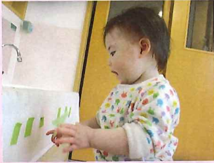
これ、いつもお友だちが遊んでるな・・・