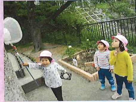
よっしゃあー！ まってて。あそこにいるみたい♪