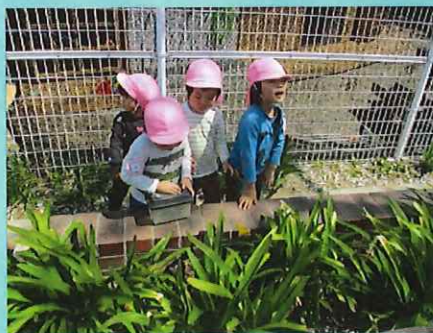
カタツムリがいたよ！

公園で遊びたいなあと朝から元気なたんぽぽ組さん！バナナ鬼やかくれんぼをしてたくさん体を動かした後は、好きな場所を見つけたり、虫探しをして楽しんでいました。