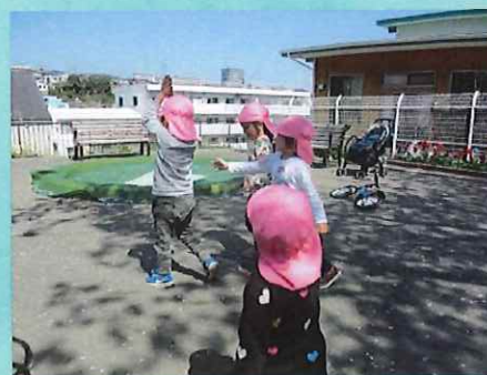
タッチ！バナナになって！