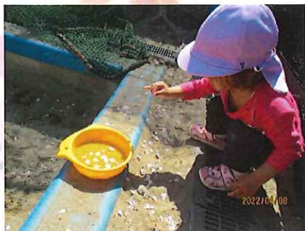
ここにいれてみよう!